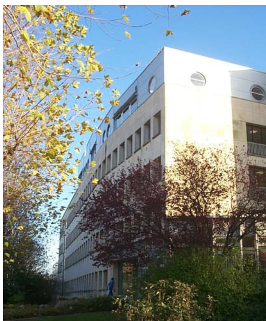
PHOTO DU BATIMENT